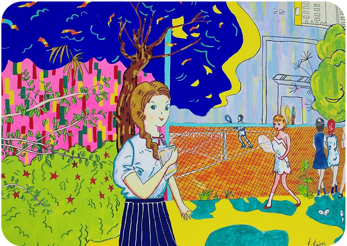
illustration by K.KAIYA